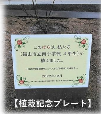
【植栽記念プレート】